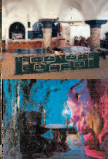
Schlossküche (li. oben), Grotte mit farbiger Beleuchtung (li. unten), Arbeitszimmer (re.), Schmuckkassette (unten)