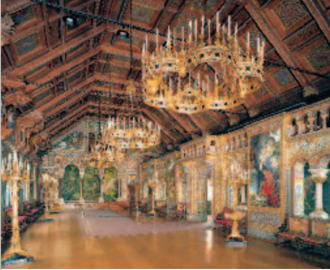
Der Sängersaal im vierten Geschoss des Palas