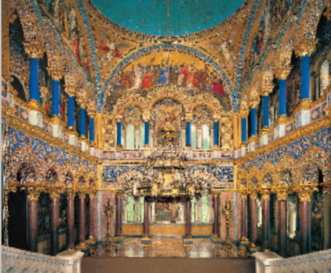
An den Wänden des Thronsaals werden heilig-gesprochene Könige und ihre Taten verherrlicht.