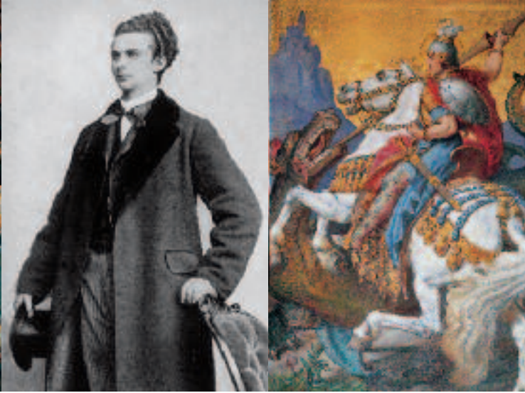
Photo von König Ludwig II. (li.); Wandbild »St. Georg tötet den Drachen« aus dem Thronsaal (re.); Majolika-Schwan (unten)