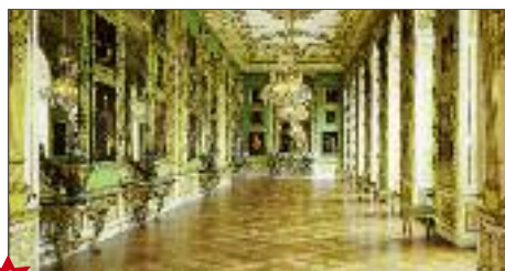
★ Galleria Verde