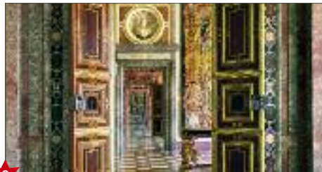
★ Stanze dei marmi