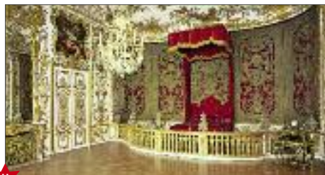
★ Camere Opulente (Reiche Zimmer)