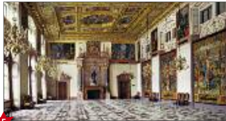
★ Scalone dell'Imperatore