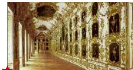
B Galleria degli Antenati