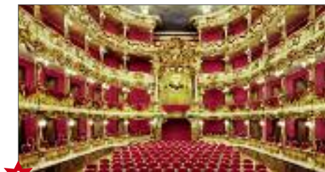
A Teatro Cuvilliés