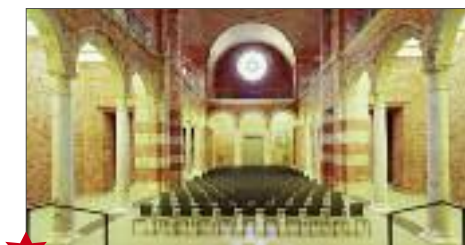
D Chiesa di corte di Ognissanti