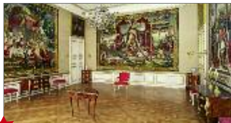
★ Stanze del Principe elettore