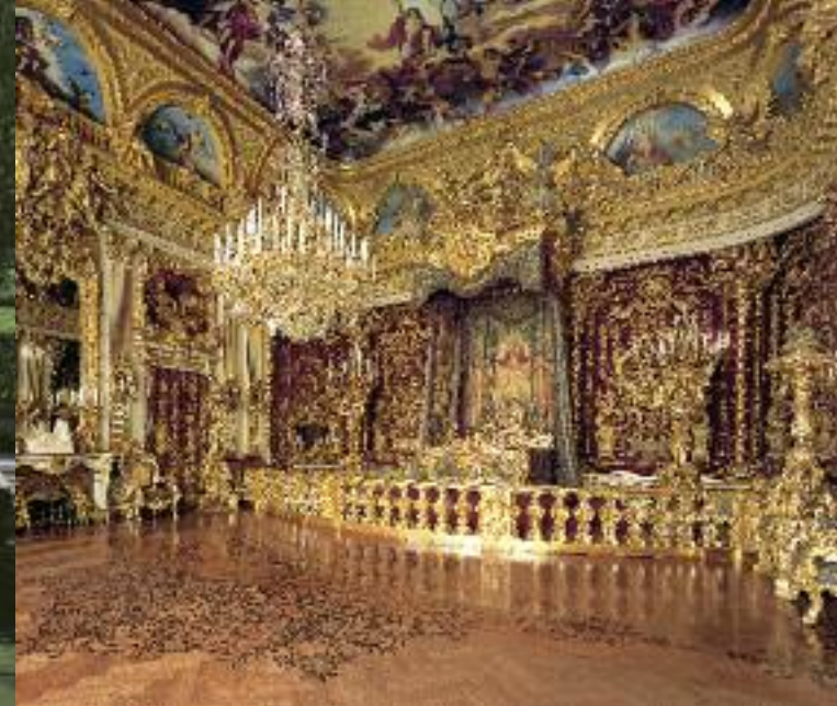
Парадная спальня во дворце Херренхимзее

Наверное самой известной в мире королевской постройкой является созданный баварским королем Людвигом II-м дворец Нойшваштайн , ежегодно притягивающий внимание около 1,3 миллионов посетителей. Для строительства этого архитектурного чуда Людвигом II-м были выбраны кулисы просто сказочной красоты – расщепленные трещинами скалистые вершины, бурлящие переливы горной реки и зеркальная гладь озер. Нойшваштайн, как больше никакое другое архитектурное творение, наглядно демонстрирует мечты и стремления этого сказочного баварского короля. Ведь задуман он был не как арена демонстрации королевской власти, а как место уединения, своеобразный приют отшельника. Именно здесь Людвиг II-й погружался в мир своих фантазий и грез – поэтический мир Средневековья. Возведенный и оформленный в стиле средневековых форм, но оснащенный по самому последнему слову техники XIX века, Нойшваштайн представляет собой один из самых впечатляющих архитектурных образцов историзма.