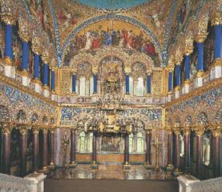
Тронный зал во дворце Нойшваштайн