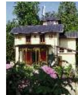
La roseraie devant l'aile est du casino

Après d'amples travaux de réparation, les pièces du casino peuvent être à nouveau visitées, tout comme le jardin des roses et sa colonne de verre bleue et blanche. Dans la maison du jardinier, une petite exposition donne des renseignements sur l'histoire de l'île.