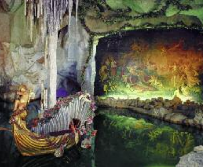
La Grotte de Vénus à Linderhof est censé reproduire l'intérieur du Mont de Vénus, l'un des lieux de l'opéra «Tannhäuser»

où Louis II a parfois pris son petit déjeuner dans un affût perché, le kiosque mauresque avec son trône aux paons, la maison marocaine, le refuge de Hunding et l'ermitage du Gurnemanz. Un rocher dans le style «Sésame-ouvre-toi!» mène à la grotte artificielle de Vénus, avec sa cascade et son lac.