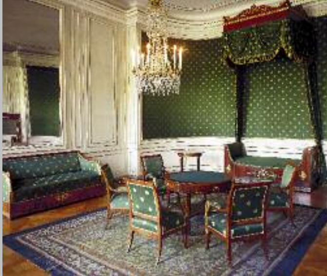
La chambre natale du château de Nymphenburg, où le roi Louis II vit le jour en 1845