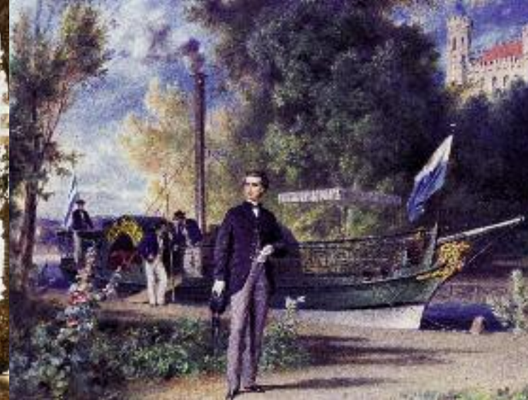
Le roi Louis II descendant à Berg de son bateau «Tristan», 1867