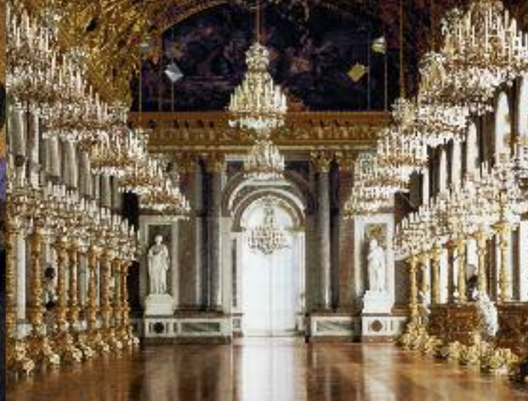
La grande Galerie des glaces du château de Herrenchiemsee

En hommage au roi de France, Louis XIV, un Versailles bavarois dut être construit. En 1886, quand Louis II mourut, les travaux n'étaient pas encore terminés mais les frais pour cet ensemble