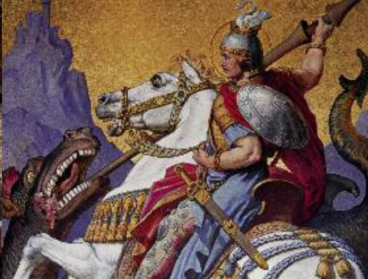
St Georges terrassant le dragon, peinture murale de la salle du trône

caractère dramatique. La décoration intérieure a pour modèle la légende chevaleresque allemande et le monde mythique de la musique de Richard Wagner. La salle des chanteurs, inspirée de la Wartburg près d'Eisenach est décorée de scènes venant du Parsifal et du Conte du Graal. Occupant deux étages et atteignant une hauteur de 15 mètres, la salle du trône exécutée toute en bleu et or, est inspirée d'une basilique byzantine. Elle n'a jamais servi.