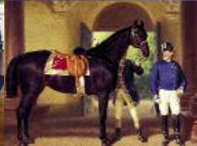
Châteaux de Nymphenburg et de Linderhof (en haut); portrait de cheval du Marstallmuseum; kiosque mauresque de Linderhof

était déjà pourvu d'un éclairage électrique: la couronne soutenue par les petits Amours servait de lanterne, son ampoule était alimentée par une pile cachée. A l'occasion des randonnées nocturnes du roi, la lueur magique de l'éclairage du traîneau frappait le peuple d'étonnement.