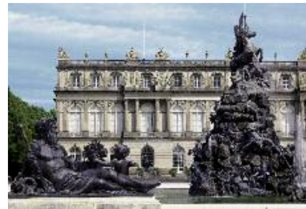
Château de Herrenchiemsee (le nouveau château)

monumental dépassaient déjà ceux de la construction de Neuschwanstein et de Linderhof réunis. La chambre à coucher d'apparat, avec son lit de 3m sur 2,6m, surpassait de loin par son luxe le modèle français. Dans la galerie des glaces longue de presque 100 mètres, plus de 1800 bougies pouvaient être allumées. En comparaison de ces deux pièces d'apparat, les appartements royaux sont aménagés plus intimement. Le château, avec son jardin à la française strictement géométrique et ses célèbres jeux d'eau faisant partie d'un projet général jamais réalisé, est entouré d'un parc naturel peuplé de vieux arbres. Dans le « König-Ludwig II.-Museum », un musée de conception moderne, on peut admirer une exposition d'objets concernant la vie et les activités du roi.