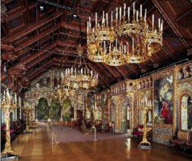
La salle des chanteurs du château de Neuschwanstein