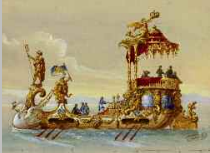
Entwurf einer Prunkbarke für König Ludwig II., Ludwig II.-Museum (oben); König Ludwig II. auf einem Armlehnstuhl sitzend, kolorierte Fotografie (unten)