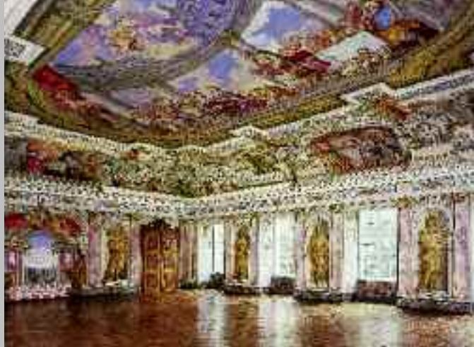
Barocker Kaisersaal mit illusionistischen Wand- und Deckenmalereien (oben); Detail eines Türflügels im Kaisersaal (unten)