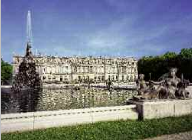
Nördliches Bassin mit dem Fama-Brunnen und der Gartenfassade des Königsschlusses (oben); Prunkvase mit Reliefbüste König Ludwigs XIV. von Frankreich (unten)