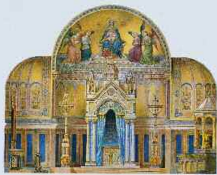
Titelmotiv der Landesausstellung (links); 3-D-Animation des geplanten Alpefluges in einem Luftschiff (rechts oben); Entwurf für die Rückwand des Prunkbettes im Neuen Schloss Herrenchiemsee, um 1875 (rechts unten)