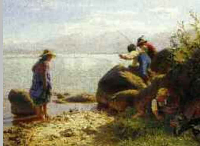
»Fischende Kinder am Chiemsee«, Gemälde von Friedrich Wilhelm Pfeiffer (1822–1891) aus der Gemäldegalerie Maler am Chiemsee