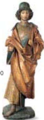
Ritterlicher Heiliger, Meister der Blütenburger Apostel

Der erste Vorhof vor der Hauptburg galt der Sicherung und Versorgung des innersten Burgbereichs. Hier mündet noch heute ein einst besonders gesicherter Aufgang von der Stadt. Von den historischen Gebäuden ist noch das Brauhaus mit Pfisterei (heute Burgcafé) erhalten. Der zweite Vorhof war mit dem mächtigen Zeughaus und dem Wohnturm des Büchsenmeisters die Rüstkammer der Burg. Diesen am ursprünglichsten erhaltenen Hof krönt das 1494 errichtete monumentale Georgstor. Der dritte Vorhof mit Haberkasten und Kornmesserturm diente einst Stallungen und Futtervorräten. Ein Juwel spätgotischer Baukunst ist die unter Georg dem Reichen 1479–1489 errichtete äußere Burkapelle im vierten Vorhof, auch Hedwigskapelle genannt. Der fünfte Vorhof nahm in den Wehrtürmen der Ringmauer die Wohn- und Amtsräume von Hofbeamten und Hofhandwerkern auf.