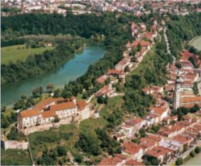
Die Burganlage zwischen Wöhrsee (li.) und Salzach (re.)