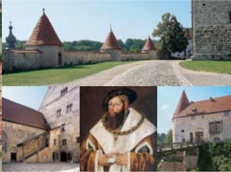
Zweiter Vorhof mit den drei »Pfefferbüchsen« (o.); Innerer Burghof (u. li.); »Georg der Reiche« (u. M.); Georgstor (u. re.)