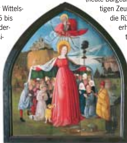
Schutzmantelmadonna, Gemälde aus der äußeren Burkapelle

1180 gelangte die Burg in den Besitz der Wittelsbacher. Ein Vierteljahrtausend – von 1255 bis 1503 – war sie die Zweitresidenz der niederbayerischen Herzöge, die in Landshut residierten. Sie diente als Hofhaltung der Herzoginnen und Witwensitz, als vornehmes Staatsgefängnis und Aufbewahrungsort des Gold- und Silberschatzes. Herzog Heinrich XIII. ließ ab 1255 die Gebäude der Kernburg errichten. Im Laufe des 14. Jahrhunderts wurde die Befestigung des Burgbergs auf die volle Länge ausgebaut. Herzog Georg der Reiche machte die Burg seit 1475 zur stärksten Festung im Land.