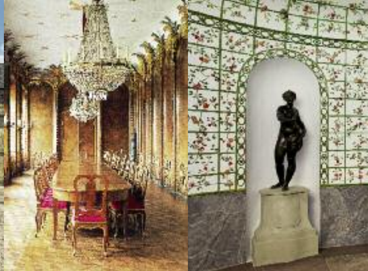
Palmzimmer, Adam Rudolph Albini, 1758 (links); Gartensaal des Italienischen Schlösschens (rechts)

Nach dem Bau des Neuen Schlosses erfuhr auch der Hofgarten eine Umgestaltung und Erweiterung. Die 1679 gepflanzte Mailbahn-Allee (Mail war ein mit Croquet vergleichbares Spiel) wurde in die Neuanlage mit einbezogen. Südlich davon ließ das Markgrafenpaar Alleen, Heckenquartiere, Laubengänge und Parterres anlegen. Ende des 18. Jahrhunderts wurde die Anlage in einen Park nach »Engländischer Art« mit sich schlängelnden Wegen und freien Pflanzungen umgewandelt. Die Grundzüge des geometrischen Gartens, der vom Kanal und drei Hauptalleen bestimmt wird, sind allerdings noch bis heute erkennbar. Das Parterre vor dem Südflügel wurde 1990 rekonstruiert.