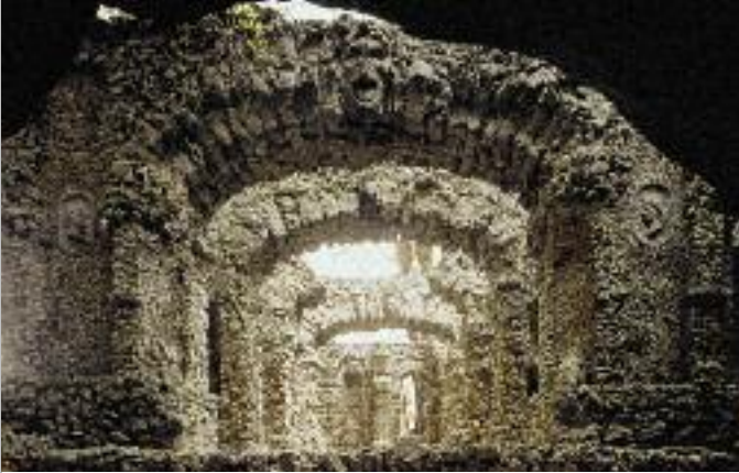
Felsengarten Sanspareil: Bühne des römischen Ruinentheaters; Abb. Titel: Neues Schloss Eremitage