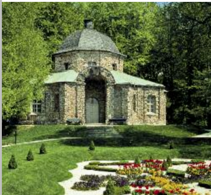
Morgenländischer Bau mit Broderie-Parterre

»C'est sans pareil!« – »Das ist ohnegleichen!« soll ein Gast Markgraf Friedrichs ausgerufen haben, als er die bizarre Felsenwelt in dem Buchenhain unweit der Burg Zwernitz erblickte. In dieser außergewöhnlichen landschaftlichen Situation entstanden zwischen 1744 und 1748 nach Plänen des Hofbaumeisters Joseph St. Pierre der Morgenländische Bau sowie der gegenüber errichtete Küchenbau, die Festlichkeiten des Bayreuther Hofes dienten. Diese beiden Bauten gruppieren sich um ein abgesetztes Gartenparterre, das 1984 nach einem Kupferstich aus dem Jahr 1748 rekonstruiert wurde. Im angrenzenden Park wurden unter weitgehender Bewahrung der natürlichen Gegebenheiten ein Ruinentheater sowie zahlreiche, meist an ostasiatischen Vorbildern orientierte kleinere Bauten errichtet, die im 19. Jahrhundert allerdings wieder verloren gingen. Das heute noch bestehende Ruinentheater zeigt die Abhängigkeit alles menschlichen Schaffens vom Faktor Zeit und erinnert daran, dass auch klassische Werke dem Verfall unterworfen sind. All diesen Parkarchitekturen dürften Ideen der hochgebildeten Markgräfin Wilhelmine zugrunde gelegen haben. In der Burg Zwernitz sind heute Hieb- und Stichwaffen sowie Mobiliar aus dem 16. bis 18. Jahrhundert ausgestellt.