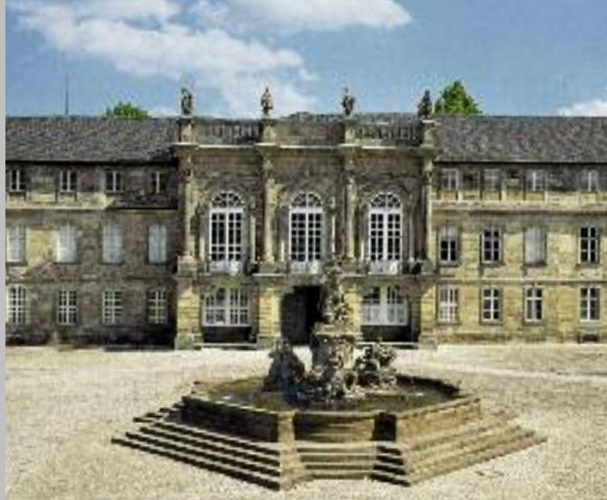
Neues Schloss Bayreuth: Markgrafen-Brunnen mit Blick auf das Corps de logis