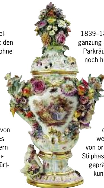
Spindler-Kabinett (li. o.); Herzogin Elisabeth Friederike Sophie von Württemberg (re. o.); Kupferstich und Gartenwerkzeuge aus dem Museum (unten); Potpourri-Vase (ganz unten)

Drei Jahre nach dem Tod seiner Gattin Wilhelmine begann Markgraf Friedrich 1761 mit den Bauarbeiten für ein Schloss in Donndorf, ohne dessen Fertigstellung zu erleben. Seine Tochter Elisabeth Friederike Sophie erhielt 1763 den Besitz und nannte ihn »Fantaisie«. Sie ließ das Schloss vollenden und bis 1780 einen spätbarocken Garten anlegen. Aus dieser Zeit sind der Pavillon, die Kaskade und der Neptunbrunnen erhalten geblieben. Ab 1793 ließ Friederike Dorothee Sophie von Württemberg die Gartenanlagen im Stil des sentimental Landschaftsgartens erweitern und eine Katakomben- und die Säule der Eintracht errichten. Herzog Alexander von Württemberg brachte Fantaisie in den Jahren