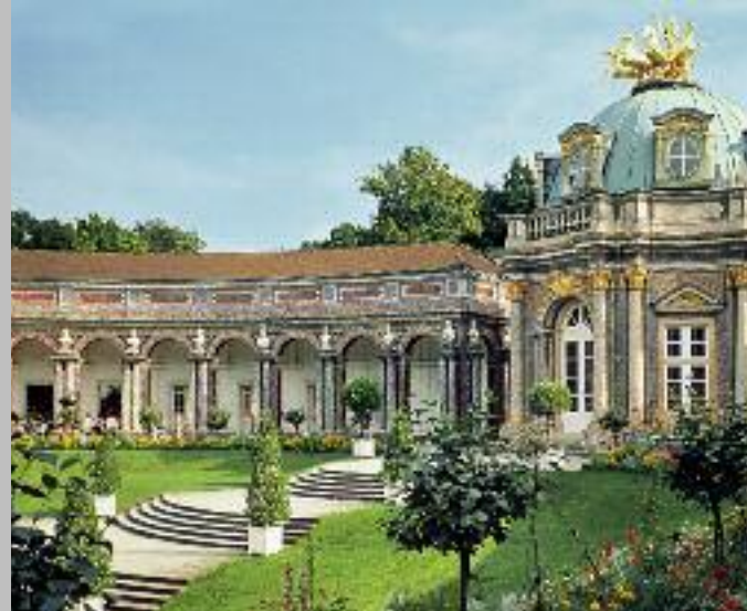
Sonnentempel des Neuen Schlosses Eremitage mit bekrönendem Sonnenwagen des Apoll

Im Gesamteindruck des Innenraums nimmt die Fürstenloge eine herausragende Stellung ein. Ihre künstlerische Gestaltung zeigt, dass die Präsenz des Markgrafenpaares genauso wichtig war wie die Theateraufführung selbst. Auch die übrige Raumdekoration wie die Ruhmesallegorien, welche mit dem markgräflichen Wappen über dem Bühnenportal schweben, diente der Verherrlichung des Herrschers. Der heute noch unversehrt erhaltene Theaterraum strahlt eine feierliche, aber auch heitere Atmosphäre aus. Das Opernhaus als Ganzes gehört zu den wenigen in Europa erhaltenen Theaterbauten des 18. Jahrhunderts. Die glanzvollen Aufführungen, vor allem während der »Fränkischen Festwochen« im Mai und Juni, sind ein ganz besonderes Erlebnis.