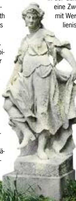
Figur der Terpsichore im Hofgarten

Nach Vollendung des Hauptschlusses ließ der Markgraf ab 1759 für seine zweite Gemahlin, Sophie Karoline von Braunschweig-Wolfenbüttel, das zunächst freistehende Italienische Schlösschen errichten. Wenig später wurde dieses mit dem Südflügel des Neuen Schlosses verbunden. Im Erdgeschoss des Neuen Schlosses befindet sich heute das Museum »Das