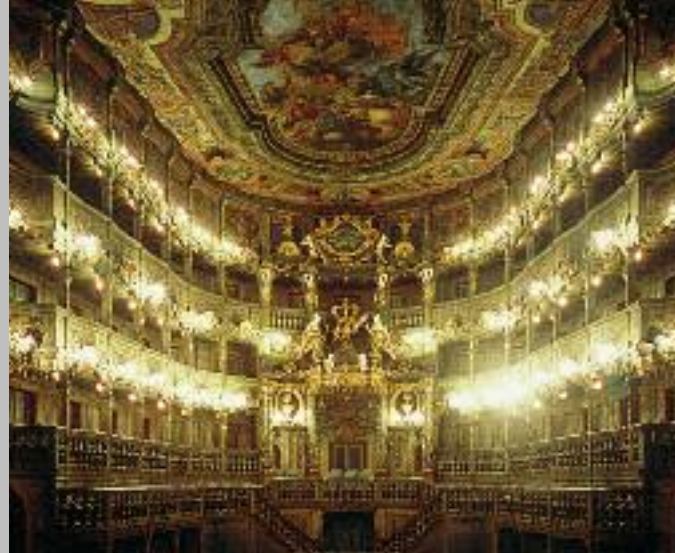
Zuschauerraum des Markgräflichen Opernhauses mit Blick auf die Fürstenloge