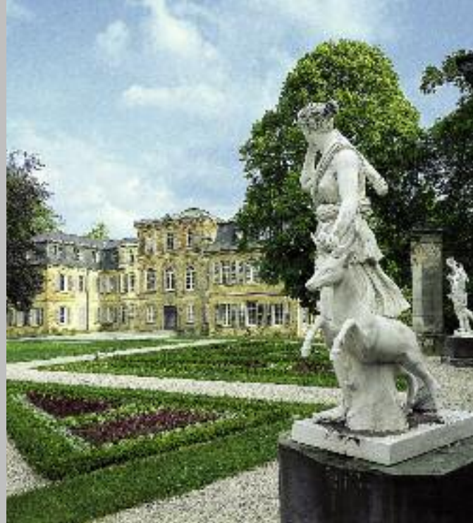
Schloss Fantaisie mit Teppichbeet und Skulpturenschmuck aus der Zeit des Historismus