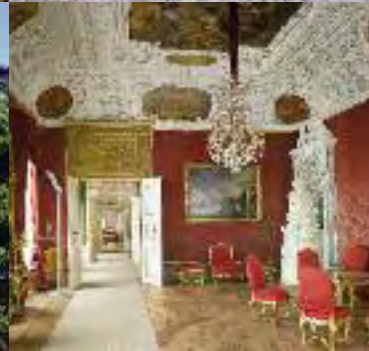
Blick vom Domplatz auf die Neue Residenz Bamberg (oben); ein Höhepunkt ist der Kaisersaal (unten u. Abb. Titel)